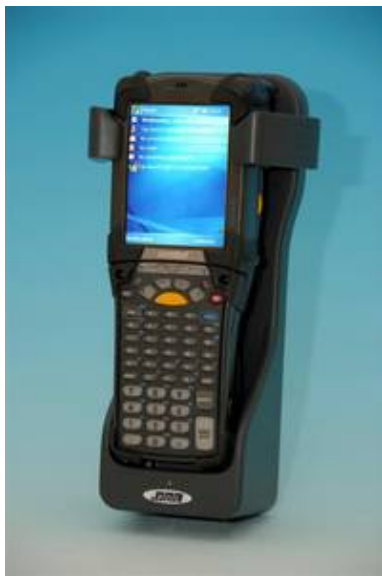
PDS Fahrzeughalterung für MOTOROLA MC9094

Der Kölner Spezialist für mobile IT-Systeme und SYMBOL Premier Solution Provider PDS stellt eine neue Systemlösung auf Basis des MOTOROLA MC9000 vor und erhält den Zu-schlag von DPD zur Ausrüstung mit mehr als 11.000 Terminals auf europäischer Ebene. Hervorragende Komponenten, die eigens nach den spezifischen Bedürfnissen des Kunden entwickelt wurden und einen deutlichen Mehr-wert bieten, gaben letztendlich den Ausschlag.